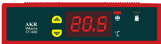
尺寸 : 140(137) X 39(31.5) X 31 mm 開孔 : 137(±0.5) X 32(±0.5) mm

* 內藏「運轉累積小時計」(999999h max) 永久記憶功能，維修保養查詢最方便，保固最佳依據。