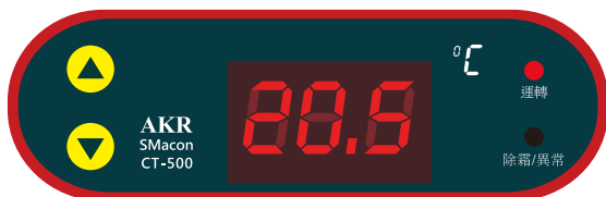
尺寸 : 81(97) X 26(34) X 40 mm 開孔 : 82.2 X 26.6 mm