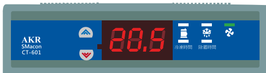
尺寸 : 140(137) X 39(31.5) X 31 mm 開孔 : 137(±0.5) X 32(±0.5) mm